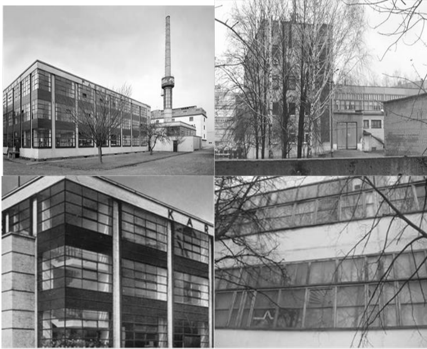
Рис. 3. Фабрика Фагуса и фабрика «Тамбовский трикотаж»

Здания и сооружения Тамбовской трикотажной фабрики имеют средний уровень эстетических качеств, архитектуру формируют довольно «молодые» постройки. Ради экономии и функциональности большинство зданий такого типа являются образцом однообразия и монотонности.