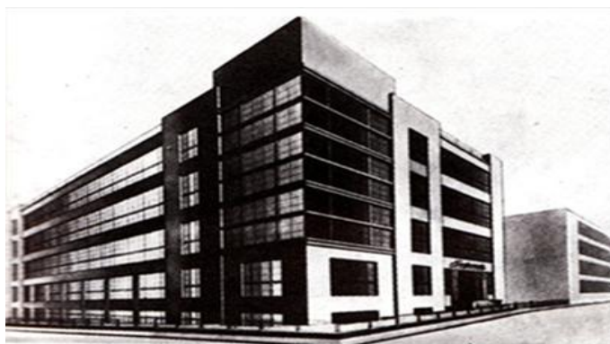
Рис. 1. Архитектор Юганов. Завод "Геофизика" в Москве, 1929 г.

Появились первые типовые проекты быстровозводимых зданий для данных предприятий, можно рассмотреть типичные примеры проектов 30-х годов (рис. 1, рис. 2).