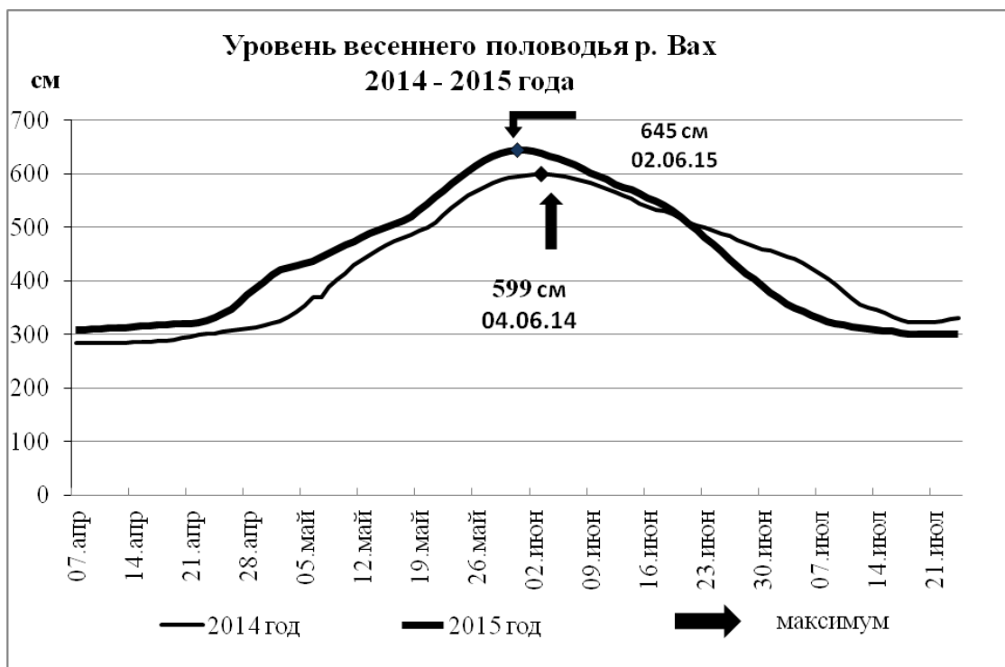
Рис. 2. Сравнительный график весеннего половодья р. Вах

На графике, изображенном, на рисунке 2 значительной разницы не наблюдается.