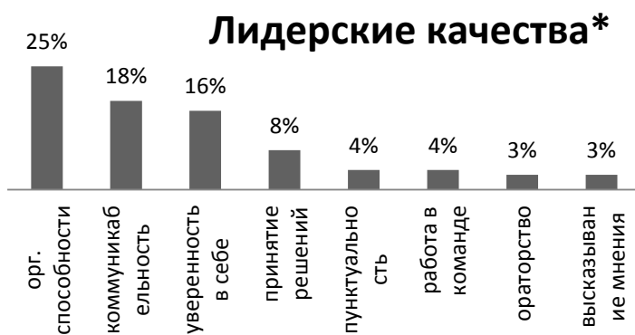
График 1. Результаты оценки: наличие лидерских качеств до и после тренинговой деятельности

Оценка влияния программы «Выбирая главный путь» показала, что участники: 77 % - выбрали профессию, 73 % - научились экономить деньги, 42 % - обрели лидерские качества, 38 % школьников отметили, что обрели уверенность в себе, 28 % - научились выступать перед аудиторией, 13 % - научились составлять свой личный бюджет. У каждого участника, принявшего участие в проекте, появилось свое личное портфолио и улучшилась успеваемость.