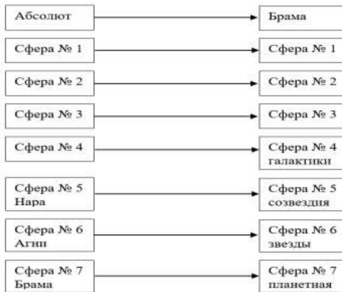
Рис. 2. Пралайи различных сфер или миров

Время Деятельности и Покоя или Пралайи для сфер Вселенных. Один такой цикл происходит за сутки объекта Абсолюта, или за год объекта № 1 в сфере Абсолюта.